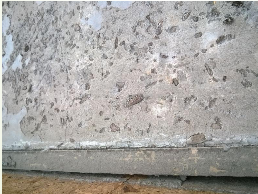
BILD Organische Bestandteile in Gesteinskörnung 8/16mm